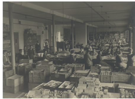
Die Parfümerie- und Seifenadjustierung, um 1921 Reproduktion Perfumery and soap adjustment, c. 1921 Reproduction