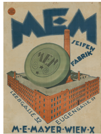
Atelier Hans Neumann Werbeplakat mit Ansicht der MEM-Fabrik in der Pernerstorfergasse 57 (die bis 1919 Eugengasse hieß), um 1919 Reproduktion Studio Hans Neumann Advertising poster with view of the MEM factory in Pernerstorfergasse 57 (called Eugengasse until 1919), c. 1919 Reproduction ÖNB Wien / Vienna: PLA16333141