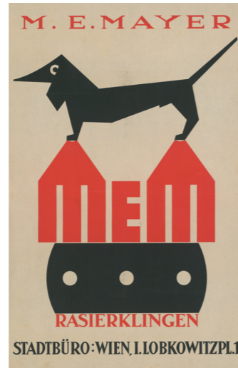
Julius Klinger Werbeplakat für die MEM-Rasierklingen, um 1922 Reproduktion Julius Klinger Advertising poster for MEM razor blades, c. 1922 Reproduction ÖNB Wien / Vienna: PLA16333163