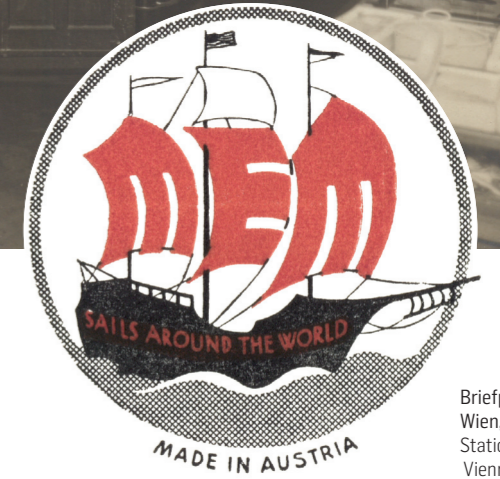
Briefpapier-Logo, Wien, um 1921 Stationery-logo, Vienna, c. 1921 Jüdisches Museum Wien / Jewish Museum Vienna