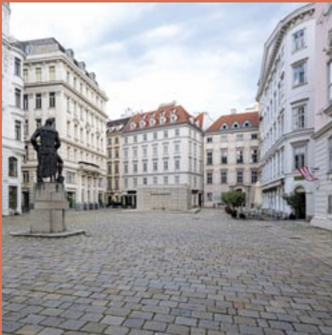
Ansicht des Judenplatzes, 2020 Judenplatz, 2020 Foto / Photo: Nafez Rerhuf, 2020