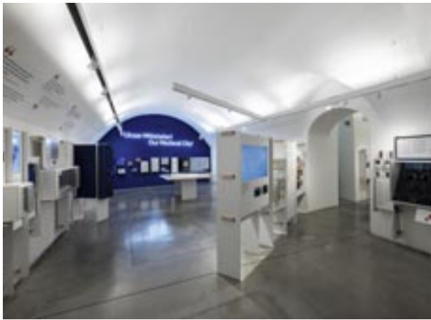
Blick in die Ausstellung / View of the exhibition Foto / Photo: Ouriel Morgensztern, 2021