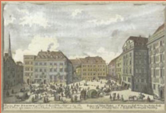
Ansicht des Judenplatzes um 1730 von Salomon Kleiner, kolorierter Nachdruck eines Kupferstichs, Wien, 1856 View of Judenplatz c. 1730 by Salomon Kleiner, colored reprint of an engraving, Vienna, 1856 Jüdisches Museum Wien, Slg. Berger / Jewish Museum Vienna, Berger Collection

Würfel und Spielsteine, die während der archäologischen Grabung in den 1990er-Jahren auf dem Judenplatz gefunden wurden Dice and game tokens found on Judenplatz in the 1990s WIEN MUSEUM Foto / Photo: Nafez Rerhuf, 2020