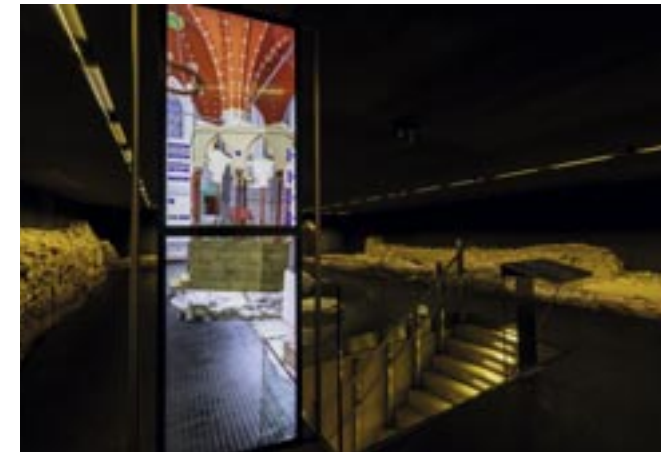
Ausgrabung mit virtueller Rekonstruktion der Synagoge The archaeological display room, featuring the virtual reconstruction of the synagogue