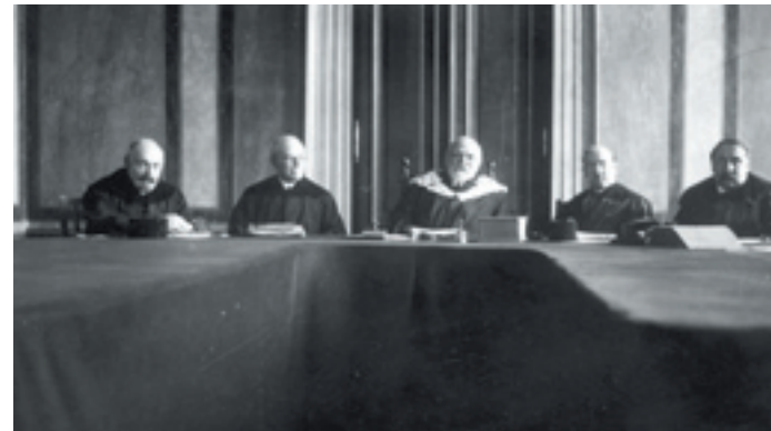
Hans Kelsen (2. v. r.) als Richter des österreichischen Verfassungsgerichtshofs, ca. 1925 Hans Kelsen (2nd from r.) as judge at the Austrian Constitutional Court, c. 1925