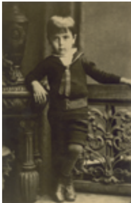
Hans Kelsen als Kleinkind, ca. 1885 Hans Kelsen as a small child, c. 1885