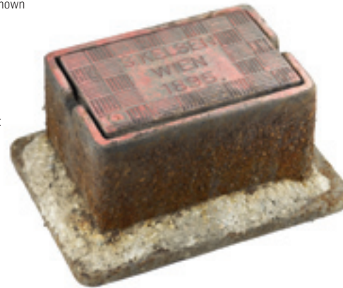
Kanaldeckel mit der Inschrift „S. Kelsen Wien 1895“ Manhole cover with inscription “S. Kelsen Wien 1895” Gusseisen / Cast iron Stg. JMW / JMW collection