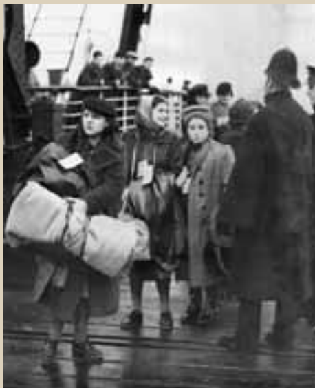
Wiener Flüchtlingskinder bei ihrer Ankunft in Großbritannien, 1938 Viennese refugee children arriving in Great Britain, 1938