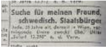
Heiratsannonce, Juni 1939 Marriage advertisement, June 1939