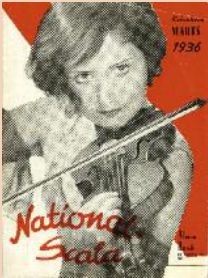
Ankündigung für einen Auftritt Alma Rosés in Kopenhagen, 1936 Announcement of a performance by Alma Rosé in Copenhagen, 1936