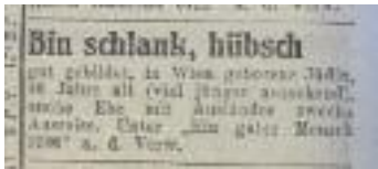
Heiratsannonce, März 1939 Marriage advertisement, March 1939