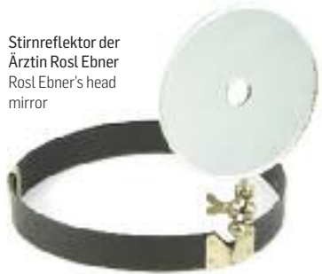
Stirnreflektor der Ärztin Rosl Ebner Rosl Ebner's head mirror